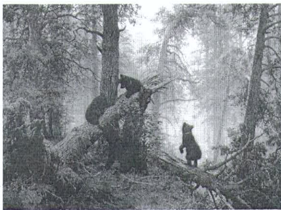
3. «Утро в сосновом лесу»